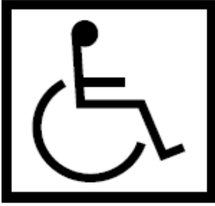
Modelo de Símbolo Internacional de Acesso